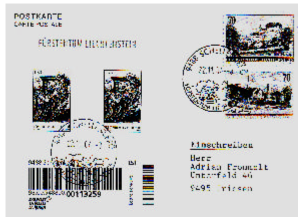
Abbildung 12: Ganzsache 112, ergänzt mit einem Paar der 1,80-Fr.-Marke „Weihnachten“, sowie einer 70-Rp.-Marke „Schellenberg“ der Serie „Dorfansichten“ (zus. 5 Fr.), als LSI-Einschreiben mit dem Ortswerbbestempel vom 22.11.04, von Schellenberg nach Triesen gesendet.