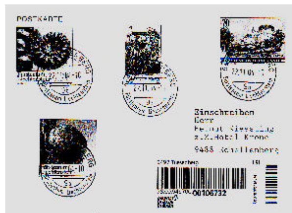
Abbildung 13: Ganzsache 112, mit der 1,80-Fr.-Marke der Serie „Weihnachten“ und je einer Marke zu 1,20 Fr. und 1,30 Fr. der Serie „Fossilien aus Liechtenstein“ (zus. 5 Fr.), als LSI-Einschreiben am 22.11.04 von Triesenberg nach Schellenberg gesendet.